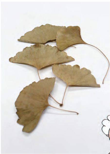
【いちちょうの葉】 夏の青々とした葉を採取し、 土用干ししたものが下付される