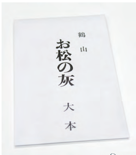
【お松灰】 本宮山の松葉のみで作られる 清らかな灰は貴重なもの

大本で下付されている松灰は、綾部・梅松苑の本宮山(禁足地)の松葉を灰にしたもので、大本二大教祖のひとり、出口王仁三郎聖師の指示により、昭和20年ごろから下付されるようになりました。耳かきで1すくいほどの少量を、水またはぬるま湯と一緒に頂きます。コップに入れた水にティースプーン1杯の松灰を入れてかき混ぜ、松灰が底に沈んだあとの上澄みの水を頂く方法もあります。