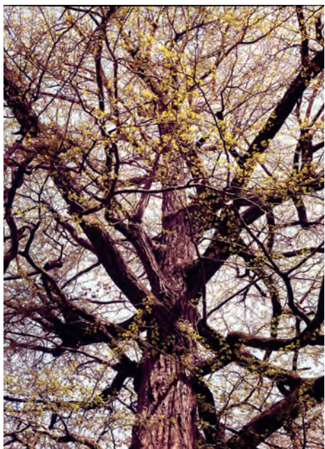
【大公孫樹】 雌株である大公孫樹は、 毎年多くのギンナンを实らせる