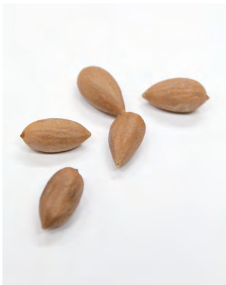
【かやの実】 生の実はあくが強く苦味があるため、食用とするには灰汁に5日間ほどつけるあく抜きが必要

大本で下付されているかやの実、は、亀岡市曾我部町穴太の瑞泉苑(出口王仁三郎聖師生家跡)の苑内にあるかやの木から採ったものです。生の実はあくが強いのですが、下付される実はあく抜きがされています。外の皮を割ってそのまま頂いたり、軽く煎って頂いてください。聖師は、「喘息は榧の実を煎って毎日食べるとよい」(『水鏡』)と記しています。