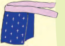
木の花帯に かすりやタレを合わせると ステキ!