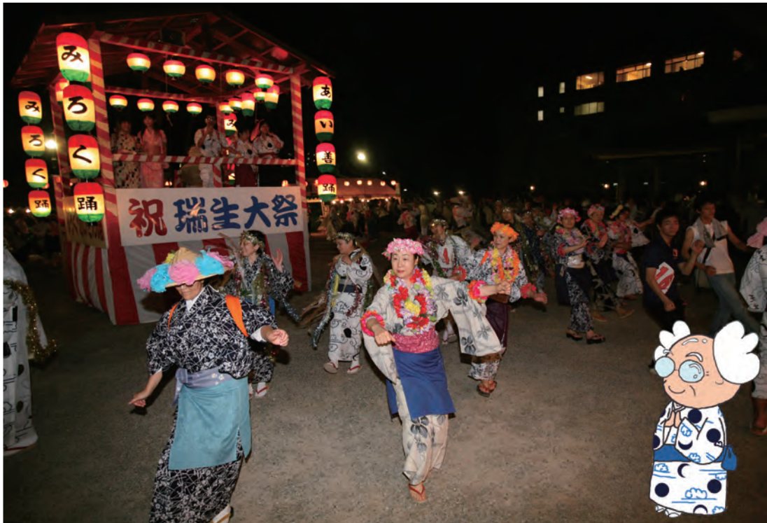
華やかな衣装で、みろく踊りを楽しむ (京都府亀岡市・天恩郷)