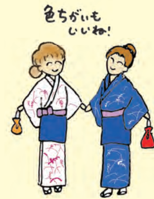
色ちがいも いいね!