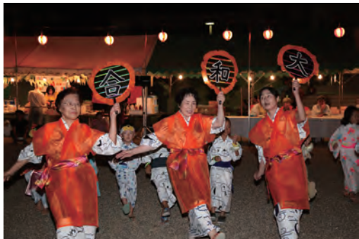
みろく踊り大会 (平成24年8月7日)