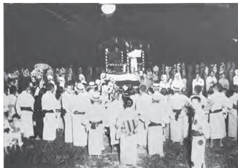
やぐらを囲んで踊る人々 (昭和6年8月) (やぐら上は出口王仁三郎聖師)