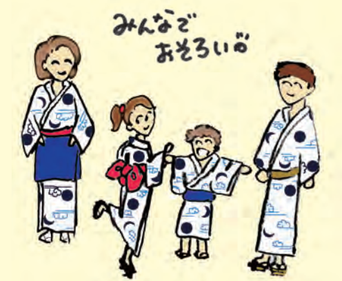
みんなぞ おそろい