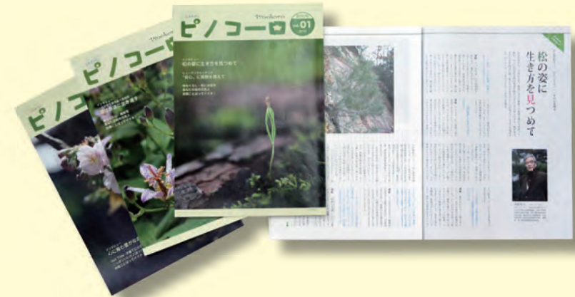
季刊紙「ピノコロ」(年4回発行)。「ピノコロ」は、世界共通語エスペラントのピーノ [松] とコロ [心] を組み合わせた造語。毎号、心温まるインタビュー記事や、身近に役立つ情報が満載です。

梅と松。この二つの樹木は、大本にとって大変ゆかりのあるシンボリック的存在です。今回は、梅と松が大本の中でどのような意味を持つのか、お伝えしましょう。