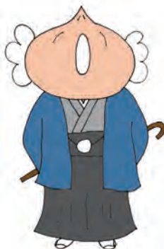
いろいろな模様が あるんじゃないかあ～