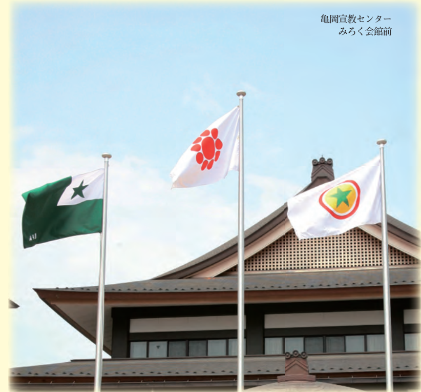
エスペラント普及会旗