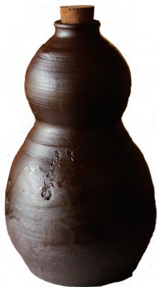
三代教主出口直日さまの筆による「きむめい水」(金明水)の書が刻まれている