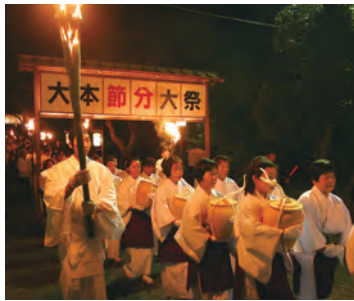
■ 瀬織津姫行事 ■ 壺に収められた人型と型代は、綾部市内をめぐり、和知川へ運ばれます