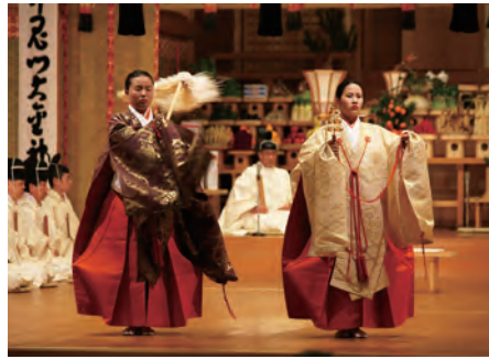
■ 大潔斎神事 ■ 二人の舞姫が鈴と麻（ぬさ）を打ち振り、宇宙全体を祓う「潔斎の舞」を舞います