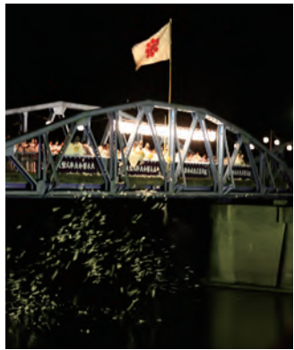
■ 人型流し ■ 祝詞が奏上される中、祭員によって人型は清流に流され、清められます