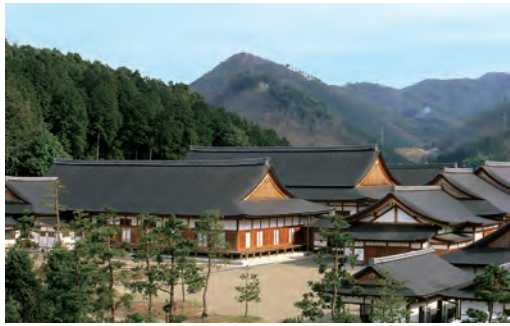
■ 長生殿 ■ 大本の発祥地である京都府綾部市にあります。日本の伝統建築の粋をこらして建てられた美しい神殿です。ここで夜を徹して祭典が行われます。