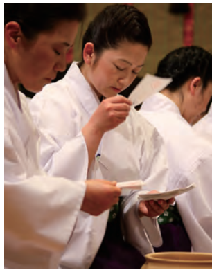
■ 小潔斎神事 ■ 人型と型代を、一枚一枚丁寧に祈願して、壺（つぼ）に収めます