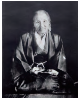
出口なお大本開祖

「三千世界一同に開く梅の花、良の金神の世になりたぞよ。梅で開いて、松で治める神国の世になりたぞよ」