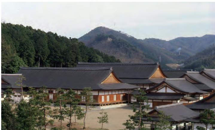
祭祀の中心地・梅松苑（京都府綾部市）

大本には、宣教の中心地である天恩郷（京都府亀岡市）と祭祀の中心地である梅松苑（京都府綾部市）の二つの聖地がありますが、「梅」は、天恩郷を、「松」は、梅松苑を象徴します。（次頁下段参照） また、祭祀の中心地である聖地・梅松苑の名前は、この「梅と松」に由来しています。