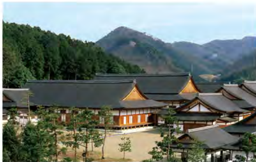
■ 長生殿 ■

大本の発祥地である京都府綾部市にあります。日本の伝統建築の粋をこらして建てられた美しい神殿です。ここで夜を徹して祭典が行われます。