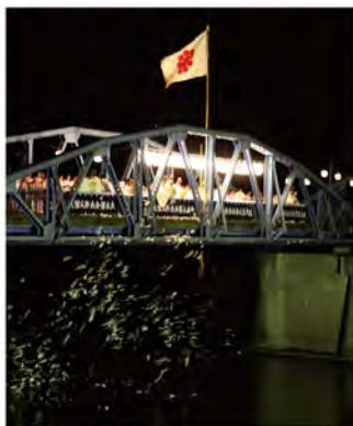
■ 人型流し ■