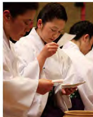
■ 小潔斎神事 ■