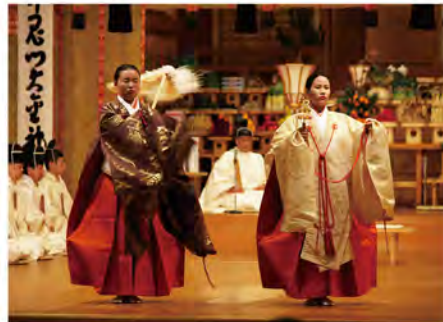
■ 大潔斎神事 ■

大本の発祥地である京都府綾部市にあります。日本の伝統建築の粋をこらして建てられた美しい神殿です。ここで夜を徹して祭典が行われます。