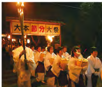
■ 瀬織津姫行事 ■