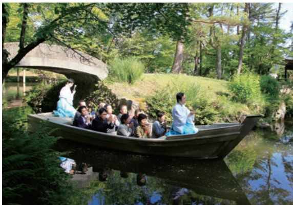
金竜海を渡って、大八洲神社へ

大道場修行の最終日には、綾部・梅松苑の金竜海にある大八洲神社に、お舟（りゅうぐう丸）に乗って参拝します。 このお舟は、修行の全日程を修了した人だけが乗ることができ、専用のものです。 日本と世界の国土の型として造られた金竜海を渡り、修行修了の奉告と、期間中のご守護のお礼を申し上げます。