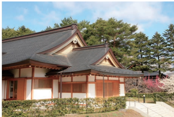
「神教殿」 (京都府亀岡市天恩郷)

亀岡市天恩郷にある神教殿は、大道場修行専用の講堂で、講座会場がここが中心となります。 神教殿の講座室には椅子席があり、ご年配や足の不自由な方も、快適に講座を聴講できます。また、子供と一緒に受講できる小部屋もあります。 詳しくは受講申し込みの際にお問い合わせください。