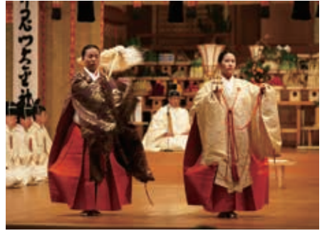
■ 大潔斎神事 ■

大本の発祥地である京都府綾部市にあります。日本の伝統建築の粋をこらして建てられた美しい神殿です。ここで夜を徹して祭典が行われます。