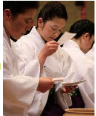
■ 小潔斎神事 ■