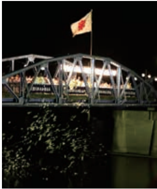
■ 人型流し ■