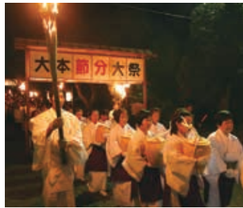
■ 瀬織津姫行事 ■